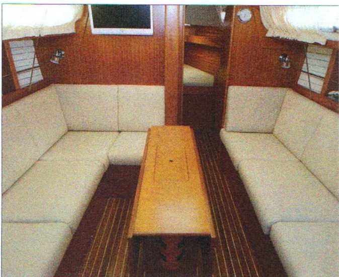
▲ Le carré en acajou est ventilé par deux panneaux ouvrants situés sur le rouf et deux autres, sur chaque bord, fixés sur la face latérale.